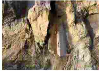
Parete rocciosa crolla durante lavori - Cronaca