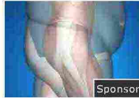
Esiste un metodo semplice che ti farà perdere 19 kg