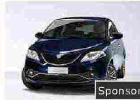
Puoi rottamare ogni veicolo targato e hai 2000€ di incentivo